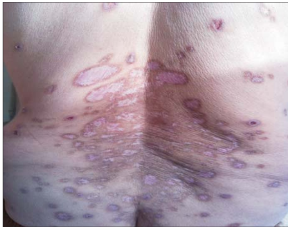
Fig. 1. Cicatrici atrofice cu margini hiperpigmentate Fig. 1. Atrophic scars surrounded by hyperpigmentation