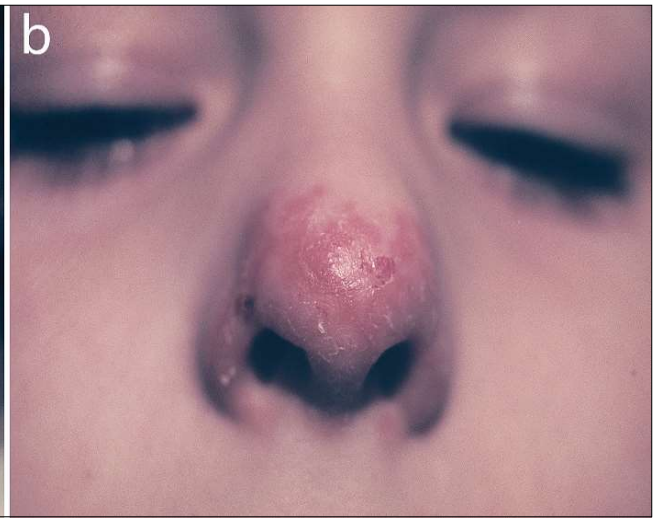
Figura 2. a. Psoriazisul lobului urechii. b. Psoriazisul vârfului piramidei nazale. Figure 2. a. Psoriasis of the ear lobe. b. Psoriasis of the tip of the nasal pyramid.