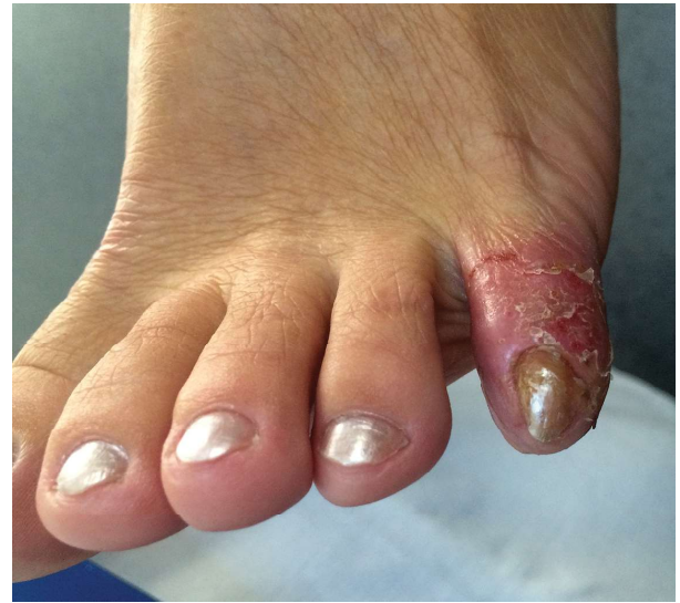
Figura 5. Acrodermatita Hallopeau. Figure 5. Hallopeau acrodermatitis.