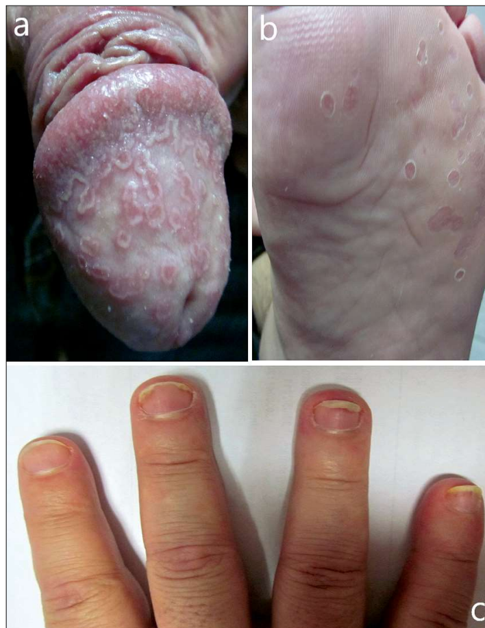
Figura 6. Artrita reacțională: a. Balanită circinată. b. Keratoderma blennorrhagicum. c. Hiperkeratoză subunghială. Figure 6. Reiter reactive arthritis: a. Circinate balanitis. b. Keratoderma blennorrhagicum. c. Subungual hyperkeratosis.