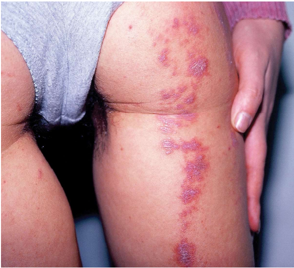
Figura 4. Psoriazisul Blaschko-liniar. Figure 4. Blaschko-linear psoriasis.