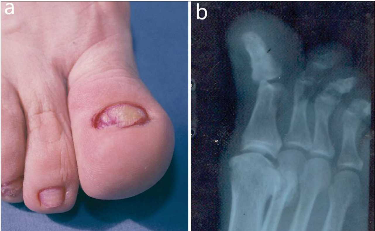
Figura 7. a, b. Onicopahidermo-periostita psoriazică a halucelui. Figure 7. a, b. Psoriatic onycho-pachydermo periostitis of the hallux.

biopsia fiind uneori necesară în stabilirea diagnosticului.