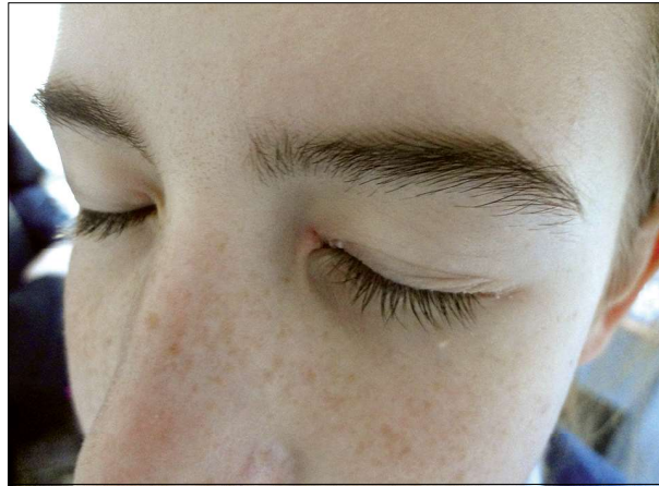
Figura 1. Psoriazis palpebral. Figure 1. Palpebral psoriasis.